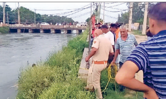
टोहाना। नहर से लड़की के शव को निकालते पुलिस कर्मचारी।

हिसार रोड स्थित फतेहाबाद ब्रांच नहर के पुल के नीचे पानी में गली-सड़ी हालत में एक युवती का शव मिला है। सुबह जब लोगों ने यहां लड़की के शव को अटक देखा तो उनमें हड़कंप मच गया और लोगों ने तुरंत इसकी जानकारी पुलिस को दी। सूचना मिलते ही पुलिस टीम मौके पर पहुंच गई और शव को नहर से बाहर निकाला गया। शव की हालत इतनी खराब है कि मृतका की पहचान करना लगभग नामुमकिन हो गया है। मिली जानकारी अनुसार टोहाना में सूबह जब लोग सैर पर निकले तो उन्होंने