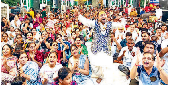
सिरसा। भजनों की प्रस्तुति देते भजन गायक।