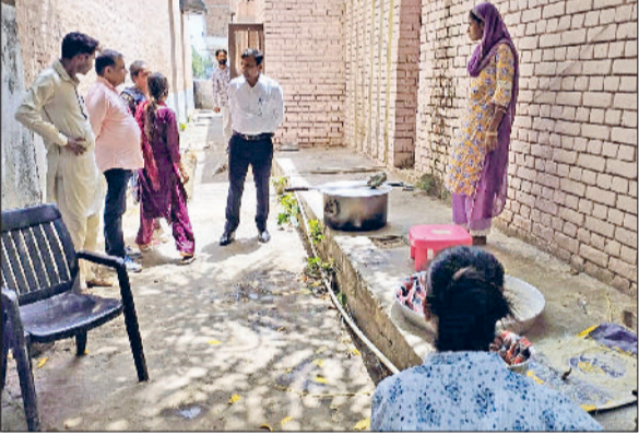
रतिया। अटल किसान-मजदूर कैंटीन का निरीक्षण करते एसडीएम।

■ महिलाओं ने भोजन और साफ-सफाई के बारे विस्तार से जानकारी ली