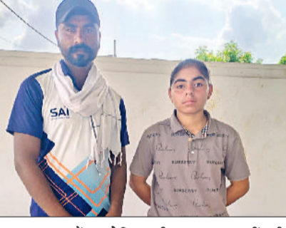
स्कूल बहबलपुर में आयोजित की गई थी। इन प्रतियोगिताओं में डीएवी स्कूल नागपुर के विद्यार्थियों ने विभिन्न खेलों में भाग लिया और शानदार प्रदर्शन किया। स्कूल की

स्कूल गोम्स फैडरेशन ऑफ इंडिया द्वारा आयोजित गोम्स में डीएवी स्कूल, नागपुर के खिलाड़ियों ने अपनी प्रतिभा का शानदार प्रदर्शन करते हुए स्कूल का नाम रोशन किया है। डिस्कस थ्रो, ट्रिपल जम्प, हैडबॉल और रिले रेस में स्कूल के विद्यार्थियों ने अपने प्रतिहंदी खिलाड़ियों को पीछे छोड़ते हुए बाजी मारी।