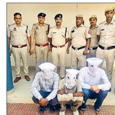
फतेहाबाद। पुलिस गिरफ्तार में पकड़े गए आरोपी।