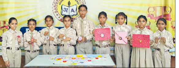
सिरसा। छात्राएं तैयार की गई राखियां दिखाते हुए।