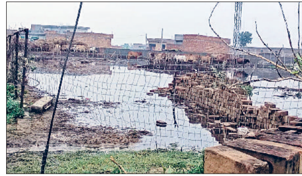
फतेहाबाद। हंस कालोनी में पशुबाड़े के कारण फैली गंदगी।

बनगांव, चिंदड़, खाराखेड़ी, बड़ोपल, सरवरपुर, तुड़यां में सबसे अधिक नुपु हाल है। इन गांवों में पहले से ही किसान सेम की समस्या से जूझ रहे हैं। ऐसे में तेज बारिश के बाद स्थिति और बिगड़ गई है। गांव रामसरा, जांडवाला बागड़ व गदली में डूबने में ज्यादा पानी भरने व ज्यादा समय से डूबने में पानी का रिसाव रहने के कारण खेतों में जलभराव हो गया है। इससे आसपास की सभी फसलें नष्ट रही हैं। अब तक इन गांवों में 20 हजार एकड़ से भी ज्यादा की फसल पानी की भेंट चढ़ चुकी है।