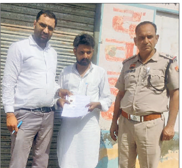
सिरसा। मेडिकल सील कर संचालक को नोटिस देती टीम।

किया। पुलिस के अनुसार मृतका की उम्र लगभग 25-26 वर्ष के आसपास हो सकती है। शव की हालत इतनी खराब है कि चेहरे की पहचान करना भी संभव नहीं है। फिलहाल पुलिस मामले की जांच में जुटी है।