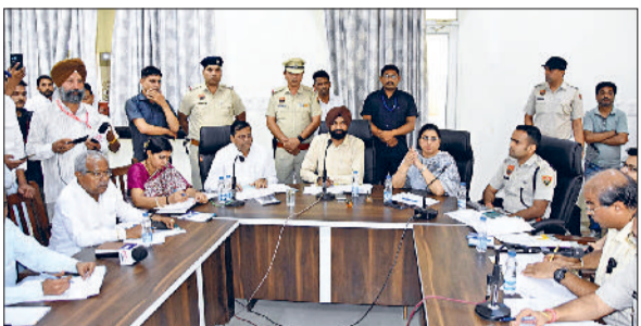
फतेहाबाद। जनसुनवाई करते अनुसूचित जाति आयोग के चेयरमैन।