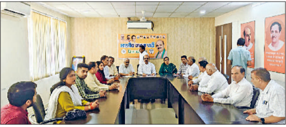
फतेहाबाद। बैठक में भाग लेते बीजेपी नेता।

■ 14 को फरीदाबाद के दशहरा ग्राउंड में आयोजित होगा विभाजन विभीषिका दिवस